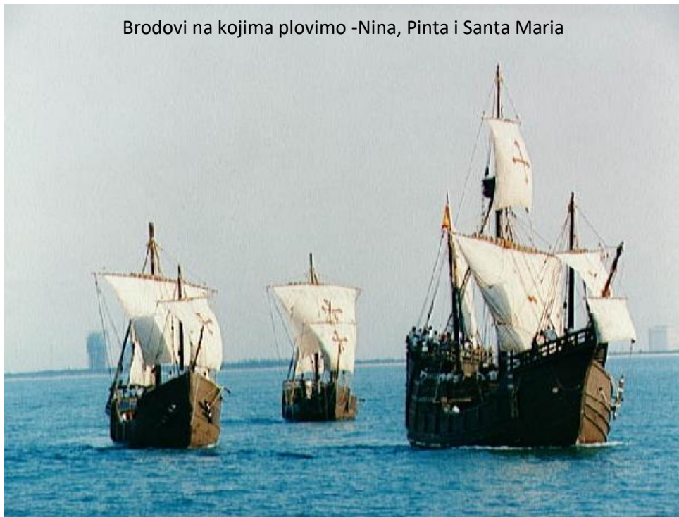
Brodovi na kojima plovimo -Nina, Pinta i Santa Maria

Buđenje na brodu, kao u nekom snu. Sva tri broda kojima plovimo privezani su jedan za drugi. Svi su zdravi, ali zbog duge šetnje i napornog planinarenja, svi imamo blagu upalu nožnih i donjih leđnih mišića. Obavljamo jutarnju higijenu, zajedno doručujemo, kapetani podižu sidra, i krećemo dalje na put. Vrijeme je pro hladno lijepo, pušu vjetrovi sa sjevera i sjeveroistoka, a valovi lagano njišu naše brodove. Plovimo sve brže kako ulazimo u ritam hodanja. Ispred nas je ogromno plavo prostranstvo, i do obale Sjeverne Amerike imamo još puno koraka za napraviti. Do ručka smo prošli puno kilometara, pa smo se nagradili dužom pauzom za ručak. Počastili smo se ribljim specijalitetima. Za vrijeme ručka zadatak nam je bio pronaći neke zanimljive stvari vezane uz Atlantski ocean (skraćeno Atlantik).